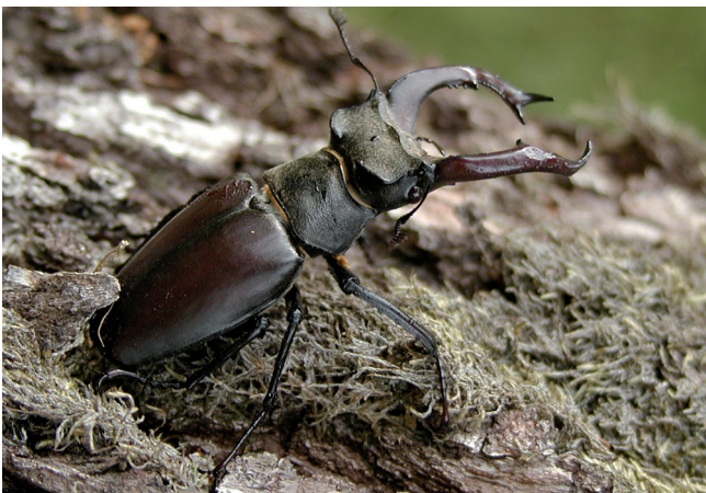
Der Hirschkäfer ist eine Flaggschiffart für Naturwaldreservate.

Direkte menschliche Eingriffe sind in diesen Gebieten verboten. Ziel der Ausweisung war zunächst, den Wald in seiner natürlichen Entwicklung zu erforschen und daraus Erkenntnisse für die naturnahe Waldbewirtschaftung zu gewinnen.