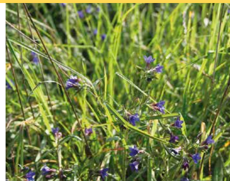
5 Der Blaurote Steinsame ( Aegonychon purpureocaeruleum ), hier auf der Mittelwaldfläche im NSG Reiterswiesen, ist eine typische Pflanze auf wärmebegünstigten, trockenen Standorten.

Bei der Waldgesellschaft im NSG Reiterswiesen handelt es sich ebenfalls um einen Waldlabkraut-Eichen-Hainbuchen-Wald. Im Baumbestand stocken 75 Traubeneichen, elf Hainbuchen und vereinzelt Feldahorn, Mehlbeere und Weißdorn. Die Grundfläche wurde mit dem letzten Hieb auf 8,4 m 2 /ha, der Vorrat auf 70 Vfm/ha reduziert. Die Totholzmenge im Naturschutzgebiet lag zum Zeitpunkt der Aufnahme (ein Jahr nach dem letzten Unterholzhieb) bei extrem geringen 1,7 m 3 /ha. Im Bodenbewuchs, der ebenfalls auf sechs Probekreisen erfasst wurde, finden sich neben der Assoziations-Charakterart Wald-Labkraut weitere Charakterarten wie Erdbeer-Fingerkraut ( Potentilla sterilis ) und Große Sternmiere ( Stellaria holostea ). Im Gegensatz zum NWR Dachsbau ist die Mittelwald-Fläche ferner gekennzeichnet durch das Vorkommen der Wiesen-Schlüsselblume ( Primula veris ), des Blauroten Steinsamens ( Aegonychon purpureocaeruleum ), der Schwalbenwurz ( Vincetoxicum hirundinaria ) sowie der Zypressen-Wolfsmilch ( Euphorbia cyparissias ): allesamt Arten, die für warme und trockene Ökosysteme und Waldränder typisch sind (Abbildung 5). Weitere Licht-, Wärme- und/oder Trockenheit-