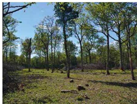
2 Naturschutzgebiet Reiterswiesen: Parkähnlich überschatten einzelne Eichen Teile der Fläche. An den Rändern türmen sich noch die Reisighaufen des letzten Unterholztriebs.

Sowohl das Naturwaldreservat »Dachsbau« (Abbildung 1) als auch die Mittelwald-Fläche im Naturschutzgebiet »Reiterswiesener Höhe – Häuserlohwäldchen« (Abbildung 2) befinden sich im Wuchsbezirk »Nördliche Fränkische Platte« sowie im FFH-Gebiet »Wälder und Trockenstandorte bei Bad Kissingen und Münnerstadt«. Beide Flächen liegen 5 km voneinander entfernt auf einer Höhe von