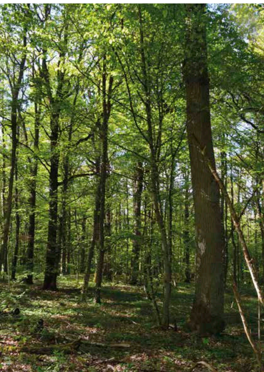
1 Naturwaldreservat Dachsbau: Unter dem Schirm dicker Eichen finden sich zahlreiche Begleitbaumarten wie Hainbuchen, Spitzahorn, Feldahorn, Winterlinde.

Die ersten 135 Bayerischen Naturwaldreservate sind seit 1978 in ihrer Entwicklung weitgehend sich selbst überlassen. Unter ihnen sind auch ehemalige Mittelwälder, die vormals eine starke Prägung durch den Menschen erfahren haben. Wohin sich diese Wälder entwickeln, wenn sie über 40 Jahre nicht mehr genutzt werden, zeigt das Naturwaldreservat »Dachsbau«. Ein interessantes Vergleichsobjekt stellt zudem das räumlich benachbarte Naturschutzgebiet »Reiterswiesen« dar, in dem seit einiger Zeit wieder aktive Mittelwaldwirtschaft betrieben wird.