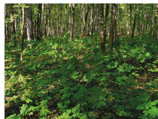
4 Üppige Bergahorn-Naturverjüngung im Naturwaldreservat Dachsbau

ter eine Vielzahl Frühjahrsgeophyten wie Buschwindröschen und Gelbes Windröschen ( Anemone nemorosa , A. ranunculoides ), nachgewiesen werden. Diese beiden Arten sind gemeinsam mit dem Efeu ( Hedera helix ) ausschlaggebend für die hohe Deckung der Krautschicht. Im Durchschnitt wurden 25 Arten je Aufnahme- und Mooschicht hinweg auf 55 Arten. Wald-Labkraut ( Galium sylvaticum ), Schatten-Segge ( Carex umbrosa ), Gold-Hahnenfuß ( Ranunculus auricomus ), Große Sternmiere ( Stellaria holostea ) und die zahlreichen Baumarten wie Hainbuche, Winterlinde, aber auch die Vogelkirsche, die in der Verjüngung beteiligt ist, sprechen pflanzensoziologisch für die Waldgesellschaft des Waldlabkraut-Eichen-Hainbuchenwaldes ( Galio sylvatici-Carpinetum betuli ) (Oberdorfer 1992), der zum Verband der Eichen-Hainbuchenwälder ( Carpinion betuli ) gehört.