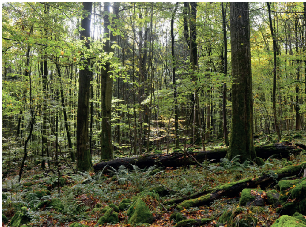
12 Das Naturwaldreservat Gitschger bietet der Fauna und Flora mehrschichtige, teils lichte Strukturen.