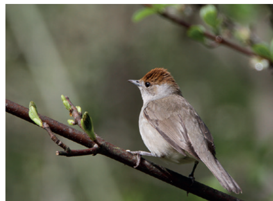
4 Die Mönchsgrasmücke als Gebüschbrüter benötigt mehrschichtige, lichte Strukturen.

2016). Auch Au- und Bruchwälder sowie Edellaubwälder bieten einen für viele Vogelarten ähnlich wertvollen Lebensraum. Im Vergleich dazu galten Buchenwälder für die Vogelwelt bislang für einen ausgeprägten Artenreichtum als eher nachrangig geeignet. In den Untersuchungen zeigte sich aber überraschend deutlich, dass auch Buchenwälder – teils mit geringen Eichenanteilen – durchaus sehr wertvoll