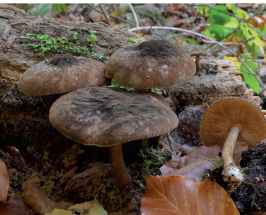
9 Der Schwarzsamige Dachpilz besiedelt stark zersetztes Buchentotholz.

Die Ergebnisse zeigen, dass gerade die Naturnähezeiger eine ausgesprochen enge Beziehung zu vielfältigen Totholzstrukturen besitzen. Aus vergleichenden Untersuchungen in Wirtschaftswäldern lässt sich aber auch folgern, dass durch ein genügendes Angebot an Totholz im Wirtschaftswald für viele dieser Arten ein ausreichender Lebensraum in genutzten Wäldern geschaffen werden kann.