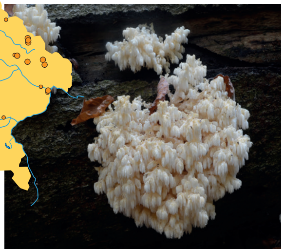
8 Der sehr seltene Ästige Stachelbart ist auf morsches Holz angewiesen. Er wächst meist auf starken Buchen. Die bizarren Fruchtkörper erscheinen im Herbst.