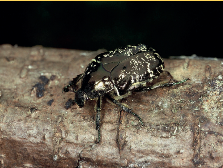
5 Der Marmorierte Rosenkäfer ist eine typische Urwaldreliktart und ist auf alte Mulmhöhlen angewiesen.