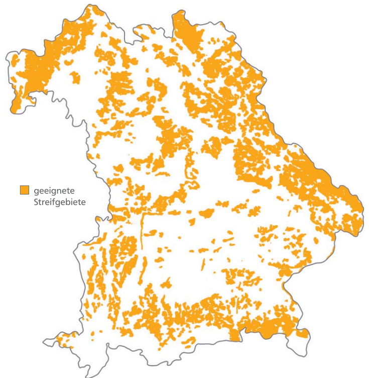
Abbildung 3: Das Streifgebietsmodell identifiziert jene Bereiche, die als dauerhafte Wildkatzenhabitate geeignet sind. Das sind heute bereits über 85 % der Waldfläche. Bezüglich der Streifgebiete im Jura ist die Karte jedoch noch nicht endgültig.

Die Wildkatze kommt in mehreren Gebieten Deutschlands häufiger und flächendeckender vor als in Bayern. Deshalb hat die Firma Ökolog für die Eifel das Vorhandensein der Wildkatze an bestimmten Orten mit den dort vorhandenen Habitatmerkmalen verknüpft und daraus ein Habitatmodell abgeleitet. Dieses Modell wurde in anderen Gebieten mit Wildkatzenvorkommen überprüft und stellte sich als sehr treffsicher heraus. Deshalb gab die Bayerische Landesanstalt für Wald und Forstwirtschaft (LWF) der Fa. Ökolog den Auftrag, das Gebiet Bayerns einer Habitatanalyse zu unterziehen, um festzustellen, wo es der Wildkatze bei uns zusagen würde. In der Eifel ist die Wildkatze z.B. sehr häufig mit dem Vorkommen von Wasser verknüpft. Dieses Element fehlt in Bayern im Jura, wo es sonst sehr gute Habitate geben würde. Aus diesem Grund ist die Habitatkarte Bayerns für den Bereich des Jura solange als vorläufig anzusehen, bis das Vorkommen der Wildkatze dort geklärt ist. Für die Habitatanalyse wurde ganz Bayern in sehr kleine Bereiche unterteilt und diese auf Wildkatzen-Eignung hin untersucht. Um die dabei berechneten kleinflächigen Strukturen mit den Bedürfnissen der Wildkatze nach Lebensräumen von circa 900 ha Größe zu verbinden, wurden gut geeignete Flächen mit den umliegenden Waldflächen zu sogenannten Streifgebieten zusammengeführt (Abbildung 3).