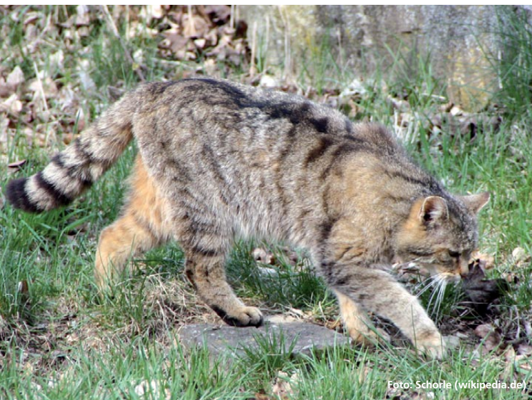
Abbildung 1: Die Wildkatze findet immer häufiger den Weg zurück nach Bayern. Für das nördliche Bayern konnten bei diesem Monitoring 37 Wildkatzenindividuen nachgewiesen werden.

Im natürlichen Sprachgebrauch haben sich für beide ersten Unterarten der Wildkatze die Begriffe Wildkatze und Hauskatze eingebürgert, die auch in diesem Artikel so verwendet werden.