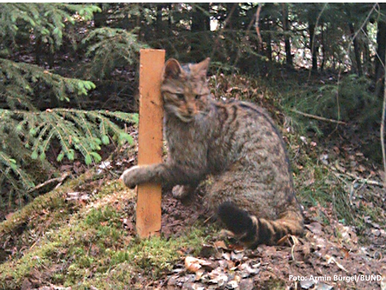
Abbildung 2: Eine Wildkatze reibt sich an einem mit Baldrian markierten Lockstock und hinterlässt dabei Haare am rauen Holz, die anschließend genetisch analysiert werden.

an die Untersuchungsstelle gesandt wird. Danach wird der Stock abgeflammt, um eventuell übersehene Haare zu beseitigen. Dann wird der Lockstock erneut mit Baldrian besprüht. So steht er wieder für den nächsten Katzenbesuch bereit.