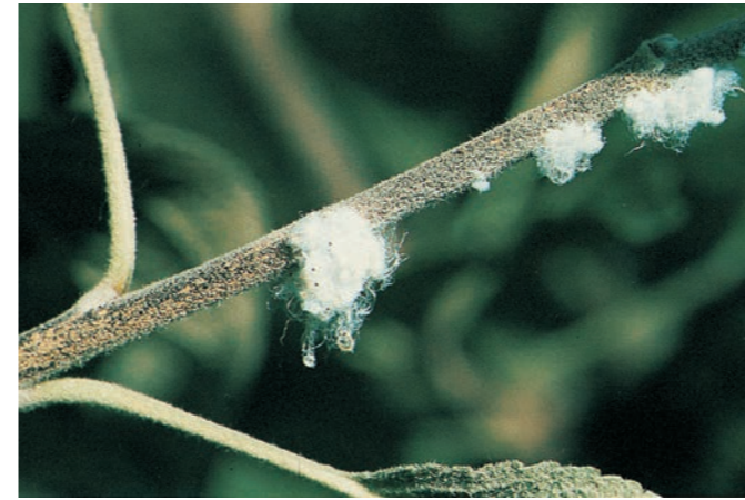
Blutlausbefall an einjährigem Trieb

Bekämpfung: Blattläuse haben viele natürliche Feinde wie Marienkäfer, Schwebfliegen, Florfliegen usw. Um diese zu schützen, sollen nur spezifische Blattlausmittel zur Bekämpfung eingesetzt werden. Das Zerdrücken oder Abspritzen mit Wasser ist um so effektiver, je früher man damit beginnt (z. B. bei den Stammüttern).