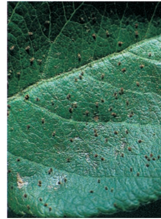
Blatt mit Obstbaumspinnmilben