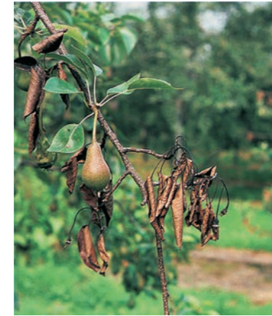
Feuerbrand an Birne

Bekämpfung: Die beiden Wirtspflanzenarten nicht zusammenpflanzen. Frühzeitig befallene Blätter abzupfen. Kegelförmige Fruchtkörper auf befallenen Wacholderästen entfernen.