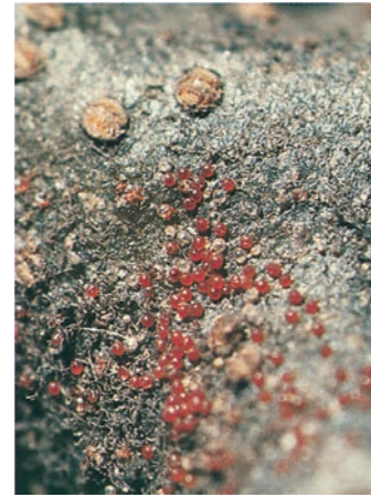
Wintereier der Roten Spinne

Bekämpfung: Die Raupen sind chemisch im Frühjahr (z. B. mit einem Entwicklungshemmer) zu bekämpfen. Im Hobbyanbau reicht das wiederholte Absammeln bzw. Zerdrücken der Blattgespinste.