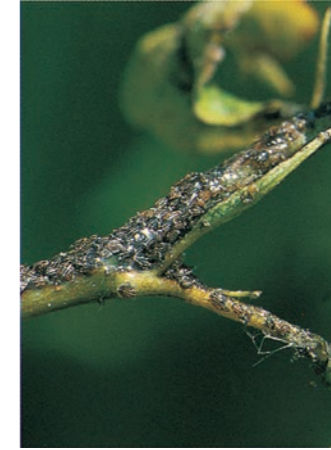
Larven des Birnblattsaugers