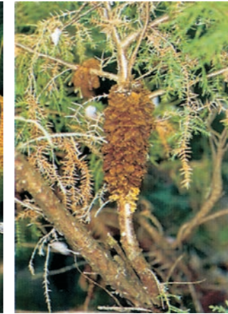
Sporenschleim an Wacholder