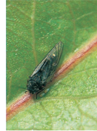
Birnblattsauger bei Eiablage

Bekämpfung: Stickstoffgaben reduzieren, nicht zu stark, aber sorgfältiger Rückschnitt der Bäume; Schnitt- und andere Wunden gut versorgen, lose Rindenstücke mit Drahtbürste entfernen, die Blutlauszehrwespe (Nützling) einbürgern.