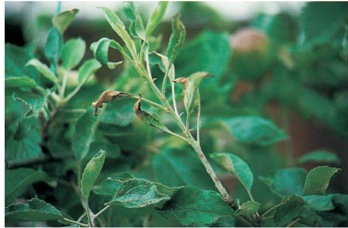
Mehltau an Triebspitze

Bekämpfung: Im Erwerbsanbau ist der wiederholte Einsatz von Fungiziden erforderlich. Im Hausgarten reicht die Beseitigung des Herbstlaubes oft schon aus, um den Befall zu mindern. Wenig anfällige Sorten: 'Florina', 'Sir Prize', 'Pinova', 'Retina', 'Reglindis', 'Resi', 'TSR'.