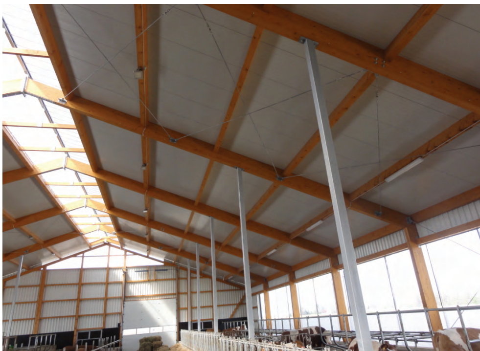
Abb. 1: Milchviehlaufstall mit LED-Beleuchtung

Im folgenden Kapitel soll daher der allgemeine Stand der Technik vorgestellt, sowie kurz auf die Vor- und Nachteile der verschiedenen Lampen eingegangen werden. Um eine näherungsweise Abschätzung der durch unterschiedliche Beleuchtungsvarianten entstehenden Investitions- und Betriebskosten zu ermöglichen, wurden eigene Berechnungen angestellt, die in Kapitel 3 Stromeinsparung und Rentabilität abgedruckt sind.