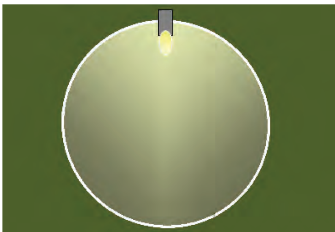
Abb. 4: Darstellung des Lichtstroms [lumen]

Unter dem Lichtstrom [lumen, lm] versteht man die Lichtleistung, die pro Zeiteinheit von einer Lichtquelle an ihre Umgebung abgegeben wird. Sie berücksichtigt dabei die unterschiedliche Lichtempfindlichkeit des menschlichen Auges für verschiedene Wellenlängen.