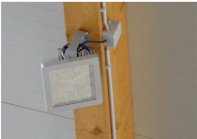
Abb. 3: LED-Strahler

In LED-Strahlern werden viele einzelne Leuchtdioden zu einer Leuchte zusammengesetzt. Bei Leuchtdioden (LED`s) handelt es sich um Bauelemente aus Halbleitern, die in Abhängigkeit vom eingesetzten Halbleitermaterial und zusätzlich eingebrachter Fremdatome (sog. „Dotierung“) unter Strom Licht spezieller Bandbreite aussenden. Um weißes Licht zu erzielen, müssen verschiedenfarbige LED`s kombiniert oder das Licht blauer LED`s mittels fluoreszierendem Leuchtmittel teilweise in gelbes Licht umgewandelt werden.