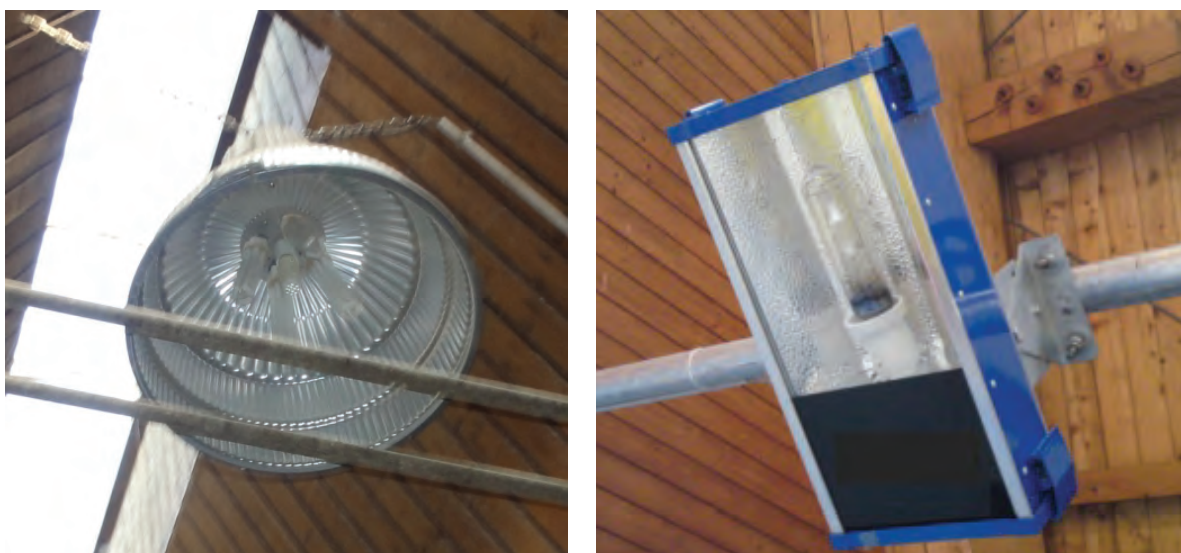
Abb. 2: Halogenmetалldampflampen: links älteres Modell, rechts neueres Modell

Um dieses Ziel zu erreichen, sowie aus Gründen der Energieeinsparung bietet es sich an, effizientere Lichtquellen einzusetzen: Natrium- oder Halogenmetалldampflampen sowie LED-Strahler. Leuchtstoffröhren werden mittlerweile fast nur noch im Betriebsleiterbüro oder im Melkstand eingesetzt. Ihre Lichtausbeute wird durch ungünstige Umgebungsbedingungen wie z.B. Kälte und Staub negativ beeinflusst. Außerdem haben sie einen vergleichsweise schlechten Wirkungsgrad und eine kürzere Lebensdauer als Metалldampflampen und LED-Strahler. Leuchtstoffröhren verursachen daher höhere Betriebs-, Wartungs- und Anschaffungskosten, da für eine ausreichende Beleuchtungsintensität im Stall sehr viele Lampen eingesetzt werden müssen.